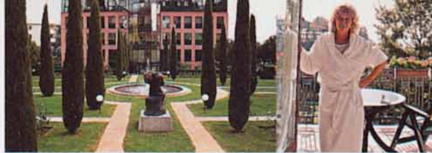
■ Schönes Ambiente für schöne Körper – die Clinique verwöhnt Leib und Seele

auf einer Wiese in der Schweiz machen sich tagein, tagaus 250 Schafe ein schönes Leben. Fressen, blöken, dösen, Pullover wachsen lassen, Kinder machen.